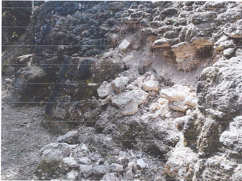
Fig.1: Perdida de mampostería en la fachada este del edificio 137 de la Acrópolis Norte del Sitio Arqueológico Yaxha.