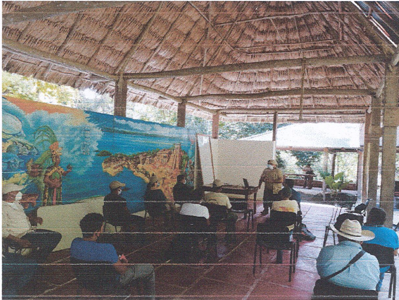
Fig.3: Taller RPI con miembros de CONAP, colaboradores del parque y representantes comunitarios aledaños al Parque Nacional Yaxha – Nakum – Naranjo.