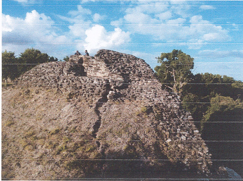
Fig.6: Deslizamiento parcial de la mampostería exterior en fachada sur del edificio 137 de la Acrópolis Norte del Sitio Arqueológico Yaxha. Fotografía tomada el 27 de noviembre del año 2020.