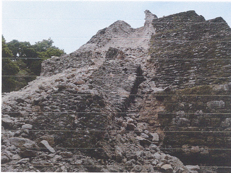
Fig.5: Fachada posterior (este) del edificio 137 de la Acrópolis Norte del Sitio Arqueológico Yaxha – fotografía tomada el 27 de noviembre del año 2020.