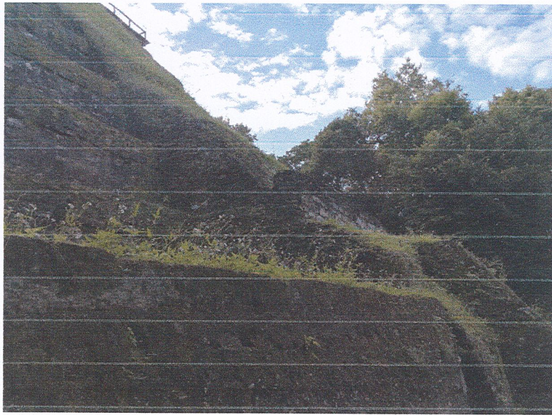
Fig.2: Capa vegetal sobre cuerpos escalonados del edificio 216 de la Acrópolis Este del Sitio Arqueológico de Yaxhá